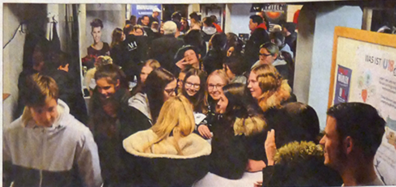
Der Andrang bei der Berufeschau war derart groß, dass zeitweise weitere Besucher nicht zugelassen werden konnten.

Viele Jugendliche nutzten das einmalige Angebot, informierten sich alleine oder zusammen mit den Eltern und führten Gespräche mit den Betreuern an den Informationsständen. Eine Schule hatte sogar einen Doppeldeckerbus eingesetzt, um die vielen Interessenten nach