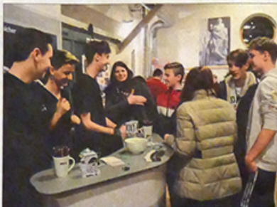
An den Ständen informierten unter anderem Zimmerer, Metzger, Techniker und Friseure.